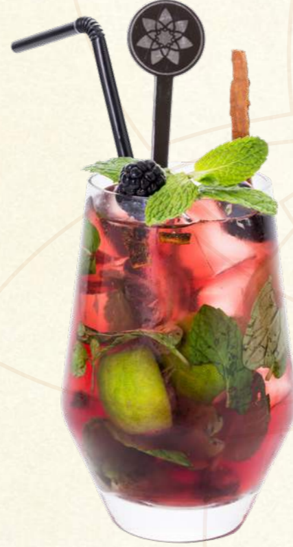
موهيتو أسود بالقرفة Black Cinnamon Mojito