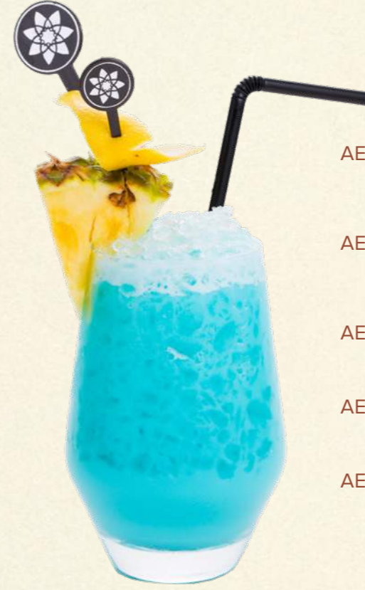
بلو أزور Blue Azure