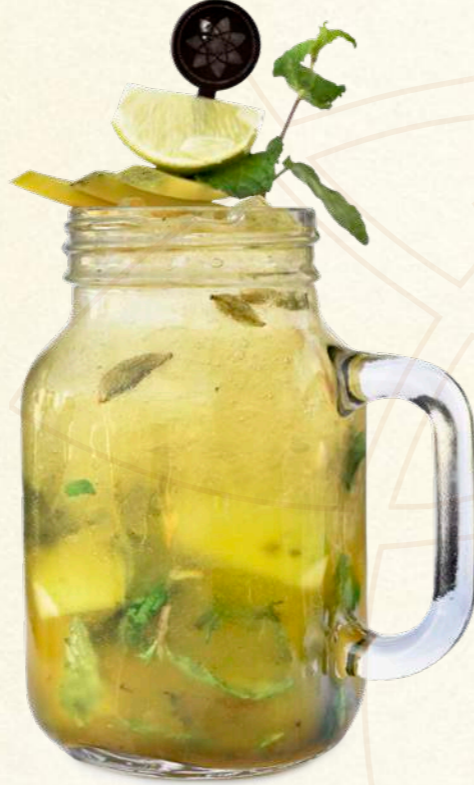
موخيتو المانجا بالهيل Cardamom Mango Mojito