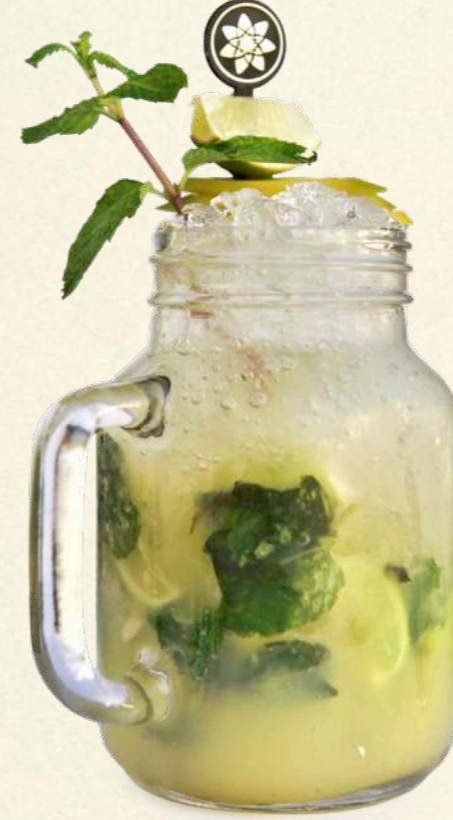
موخيتو الليتشى والتفاح Lychee Apple Mojito